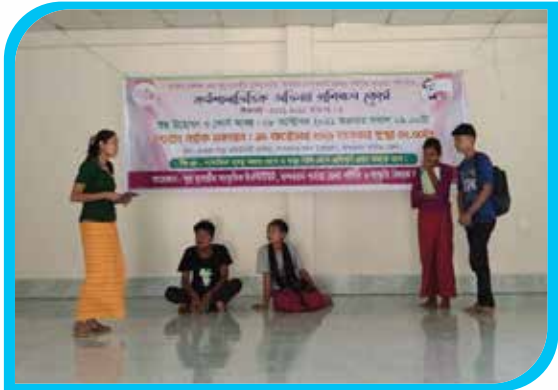
সাত কর্মদিবস মেয়াদি কর্মশালাভিত্তিক অভিনয় প্রশিক্ষণ কোর্স ও খেয়াং নাটক মঞ্চায়ন, গুংগুরু পাড়া, বান্দরবান সদর উপজেলা