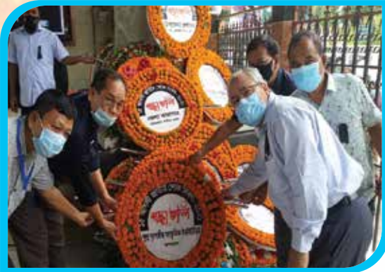
জাতির পিতা বঙ্গবন্ধু শেখ মুজিবুর রহমানের ৪৬তম শাহাদাত বার্ষিকীতে জাতীয় শোক দিবস উপলক্ষে বঙ্গবন্ধু মুক্তমঞ্চ জাতির পিতা বঙ্গবন্ধু শেখ মুজিবুর রহমানের প্রতিকৃতিতে পুষ্পস্তবক অর্পণ