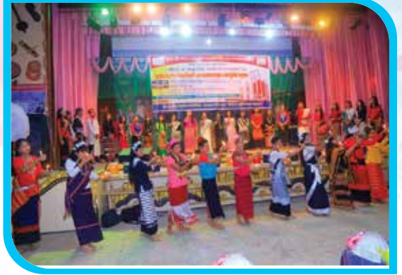
বাংলা ও ১১টি নৃ-গোষ্ঠীর মাতৃভাষায় 'আমার ভাইয়ের রক্তে রাঙানো একুশে ফেব্রুয়ারি' গানটি পরিবেশন