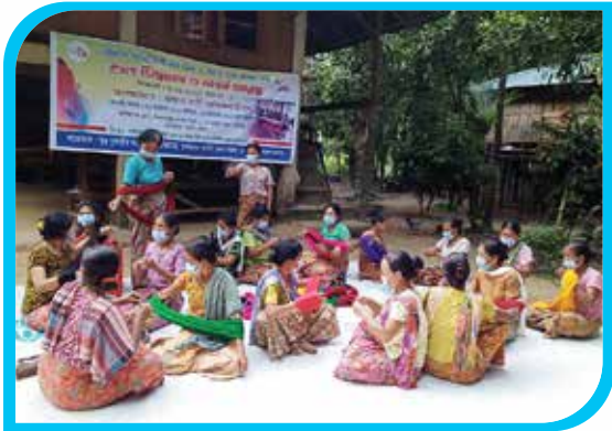
দুই মাস মেয়াদি মারমাদের ঐতিহ্যবাহী তাঁত বুনন ও পোশাক তৈরি প্রশিক্ষণ কোর্স, শিলেরতুয়া মারমা পাড়া, লামা পৌরসভা