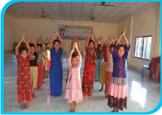
এক মাস মেয়াদি খেয়াং নৃত্য প্রশিক্ষণ কোর্স গুংগুরু পাড়া, বান্দরবান সদর উপজেলা