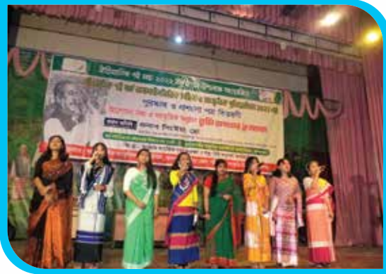
ঐতিহাসিক ৭ই মার্চ উপলক্ষে আয়োজিত সাংস্কৃতিক অনুষ্ঠানে ইনস্টিটিউটের শিক্ষার্থীদের সমবেত কণ্ঠে সংগীত পরিবেশন