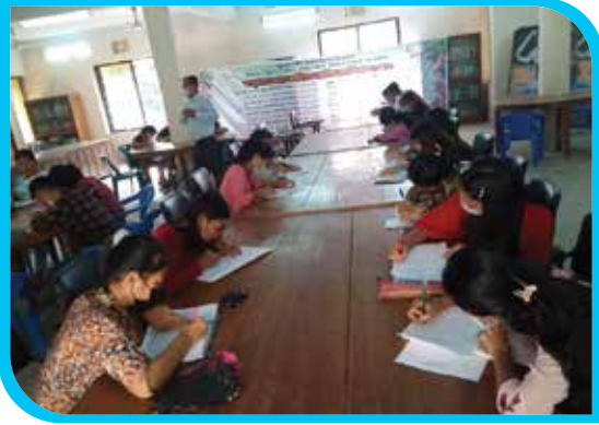
বম ভাষায় সাহিত্য প্রতিযোগিতা ক্ষুদ্র নৃ-গোষ্ঠীর সাংস্কৃতিক ইনস্টিটিউট, বান্দরবান