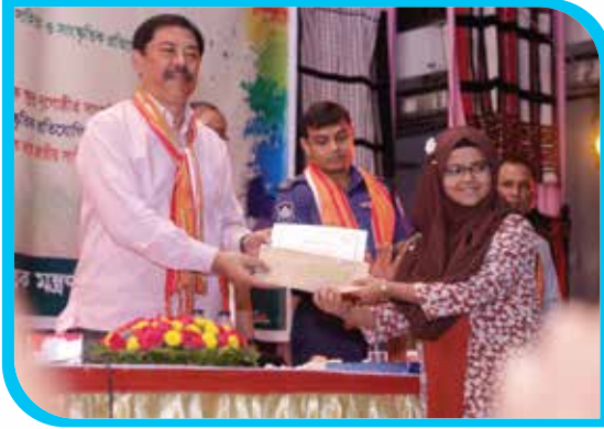
সুবর্ণজয়ন্তী রচনা প্রতিযোগিতার পুরস্কার ও প্রশংসা পত্র বিতরণ করছেন পার্বত্য চট্টগ্রাম বিষয়ক মন্ত্রণালয়ের মাননীয় মন্ত্রী জনাব বীর বাহাদুর উশৈসিং, এমপি মহোদয়