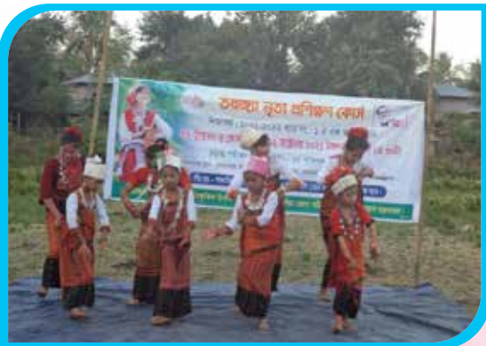
এক মাস মেয়াদি তঞ্চঙ্গ্যা নৃত্য প্রশিক্ষণ কোর্স নোয়াপতং, রোয়াংছড়ি উপজেলা