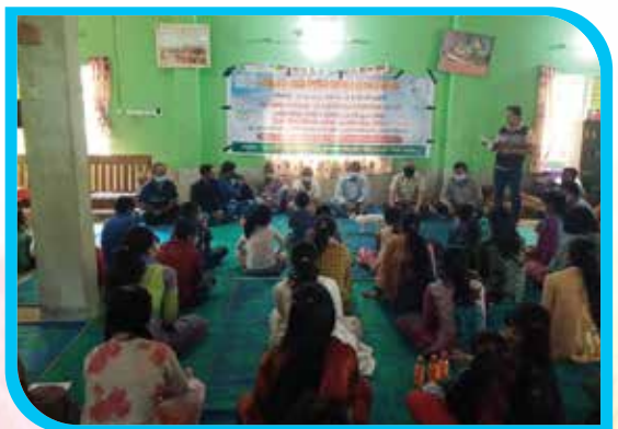
দুই মাস মেয়াদি তঞ্চঙ্গ্যা ভাষা শিক্ষা কোর্স (অক্ষর জ্ঞান) রাজবিলা, বান্দরবান সদর উপজেলা