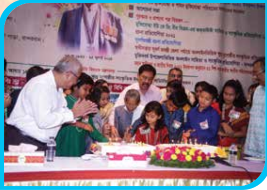
বীর মুক্তিযোদ্ধা ইউ কে চিং বীর বিক্রম-এর ৯০তম জন্মবার্ষিকী ২০২২ উপলক্ষে ইউ কে চিং বীর বিক্রম-এর স্ত্রী ও শিশুদের নিয়ে কেক কাটছেন পার্বত্য চট্টগ্রাম বিষয়ক মন্ত্রণালয়ের মাননীয় মন্ত্রী জনাব বীর বাহাদুর উশৈসিং, এমপি মহোদয়