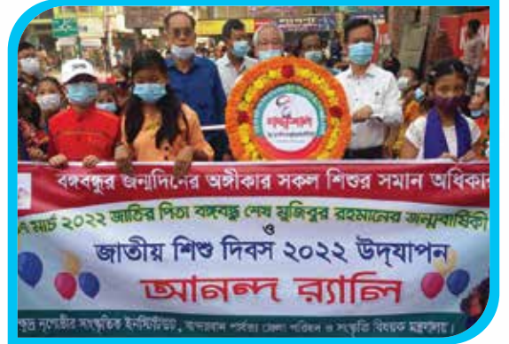
জাতির পিতা বঙ্গবন্ধু শেখ মুজিবুর রহমানের জন্মবার্ষিকী ও জাতীয় শিশু দিবস ২০২২ উপলক্ষে আনন্দ র্যালি