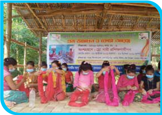
দুই মাস মেয়াদি শ্রোদের ঐতিহ্যবাহী তাঁত বুনন ও পোশাক তৈরি প্রশিক্ষণ কোর্স, গজালিয়া, লামা উপজেলা