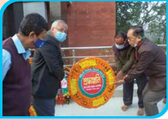
বিজয়ের সুবর্ণজয়ন্তী ও মহান বিজয় দিবস ২০২১ উপলক্ষে বান্দরবান পার্বত্য জেলা পরিষদ চত্বরে মুক্তিযুদ্ধ স্মৃতিস্তম্ভে পুষ্পস্তবক অর্পণ