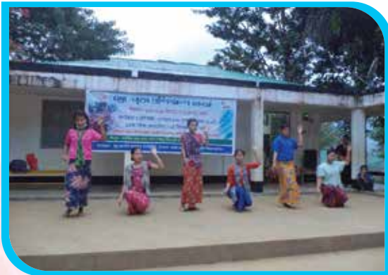
এক মাস মেয়াদি শ্রো নৃত্য প্রশিক্ষণ কোর্স আশার আলো হোস্টেল, থানচি উপজেলা