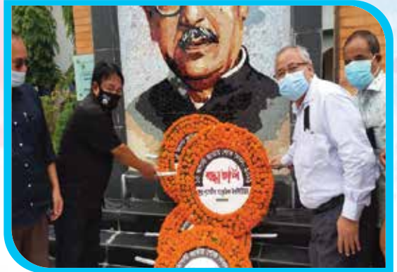
জাতির পিতা বঙ্গবন্ধু শেখ মুজিবুর রহমানের ৪৬তম শাহাদাত বার্ষিকীতে জাতীয় শোক দিবস উপলক্ষে বান্দরবান পার্বত্য জেলা পরিষদ চত্বরে জাতির পিতা বঙ্গবন্ধু শেখ মুজিবুর রহমানের প্রতিকৃতিতে পুষ্পস্তবক অর্পণ