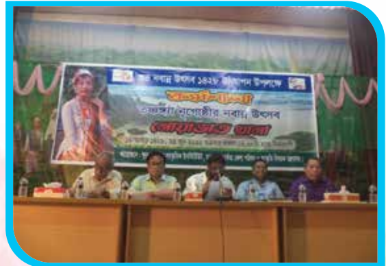
শুভ নবান্ন উৎসব ১৪২৮ উপলক্ষে 'তঞ্চঙ্গ্যা নৃ-গোষ্ঠীর নবান্ন উৎসব - নোয়াভাত খানা' শীর্ষক কর্মশালা