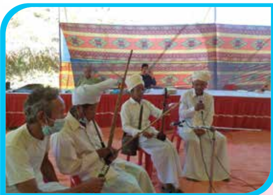
ম্রোদের লোকসাংস্কৃতিক উৎসব ২০২১ উপলক্ষে ম্রো লোকসংগীত মেং পরিবেশন