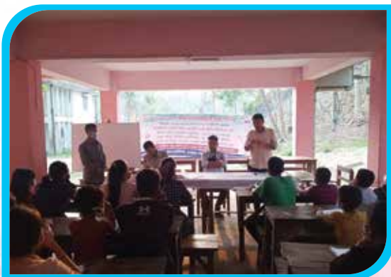
দুই মাস মেয়াদি চাক ভাষা শিক্ষা কোর্স (অক্ষর জ্ঞান) কালাঘাটা, বান্দরবান পৌরসভা