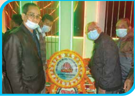
মহান শহিদ দিবস ও আন্তর্জাতিক মাতৃভাষা দিবস ২০২২ উপলক্ষে শহিদ মিনারে পুষ্পস্তবক অর্পণ