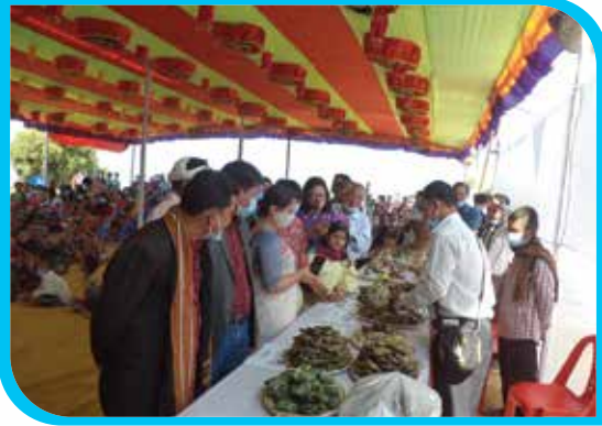
প্রধান অতিথি কর্তৃক নতুন ধানের পিঠামেলা পরিদর্শন