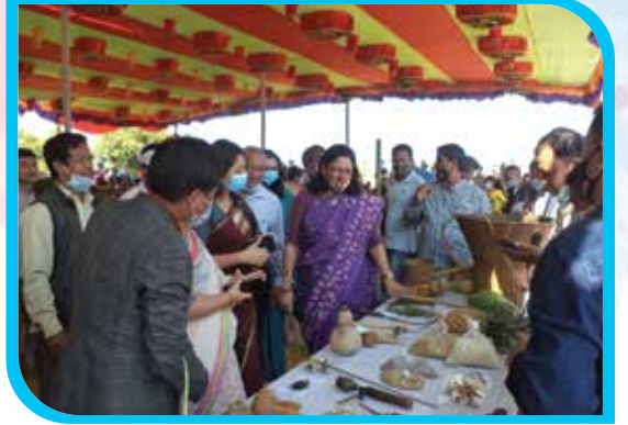
প্রধান অতিথি কর্তৃক জুমাচাষের সরঞ্জামাদি ও জুমের নতুন ফসল পরিদর্শন