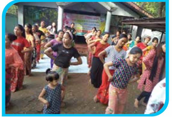
এক মাস মেয়াদি মারমা নৃত্য প্রশিক্ষণ কোর্স বালাঘাটা, বান্দরবান পৌরসভা