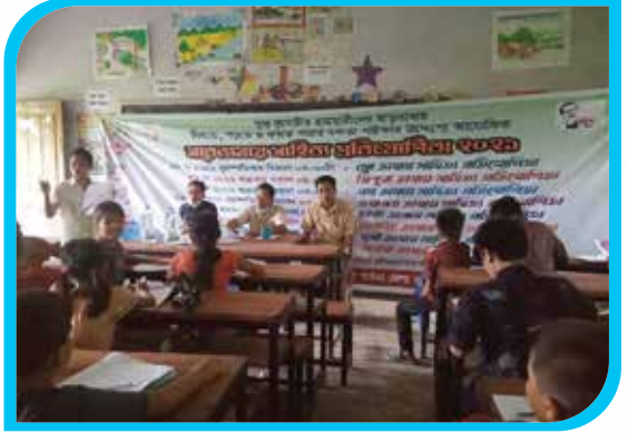
তঞ্চঙ্গ্যা ভাষায় সাহিত্য প্রতিযোগিতা রেইছা উচ্চ বিদ্যালয়, রেইছা, বান্দরবান সদর উপজেলা