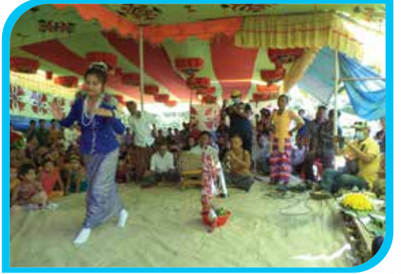
মারমাদের লোকসাংস্কৃতিক উৎসব ২০২১ উপলক্ষে মাসলিক লোকনৃত্য পোয়েঃউঃ আকা পরিবেশন