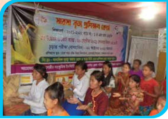
এক মাস মেয়াদি মারমা নৃত্য প্রশিক্ষণ কোর্স তংফ্র পাড়া, রোয়াংছড়ি উপজেলা