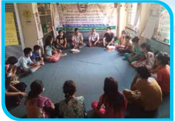
দুই মাস মেয়াদি চাক ভাষা শিক্ষা কোর্স (অক্ষর জ্ঞান) বাইশারী, নাইক্ষ্যংছড়ি উপজেলা