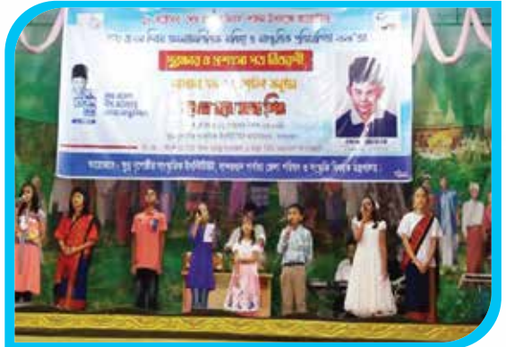
শেখ রাসেল দিবস ২০২২ উপলক্ষে আয়োজিত সাংস্কৃতিক অনুষ্ঠানে ইনস্টিটিউটের শিশু শিক্ষার্থীদের সমবেত কণ্ঠে সংগীত পরিবেশন