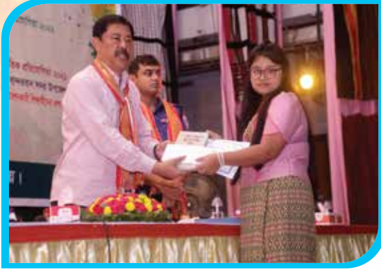
মুজিববর্ষ উপজেলাভিত্তিক অনলাইন সাহিত্য ও সাংস্কৃতিক প্রতিযোগিতার পুরস্কার ও প্রশংসা পত্র বিতরণ করছেন পার্বত্য চট্টগ্রাম বিষয়ক মন্ত্রণালয়ের মাননীয় মন্ত্রী জনাব বীর বাহাদুর উশৈসিং, এমপি মহোদয়