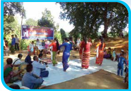
তিন মাস মেয়াদি মারমা লোকনাট্য জ্যাৎ অভিনয় প্রশিক্ষণ কোর্স বুড়ি পাড়া, বান্দরবান সদর উপজেলা