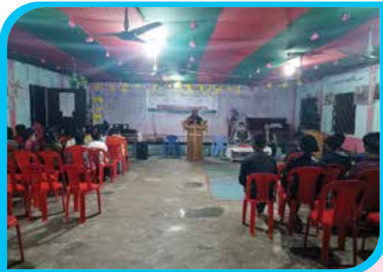
দুই মাস মেয়াদি ত্রিপুরা ভাষা শিক্ষা কোর্স (অক্ষর জ্ঞান) বিলছড়ি, লামা উপজেলা