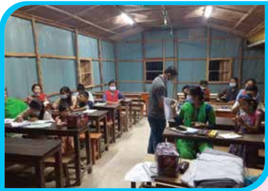
চাকমা ভাষায় সাহিত্য প্রতিযোগিতা, বান্দরবান বৌদ্ধ অনাথালয় নিম্নমাধ্যমিক উচ্চ বিদ্যালয়, বান্দরবান