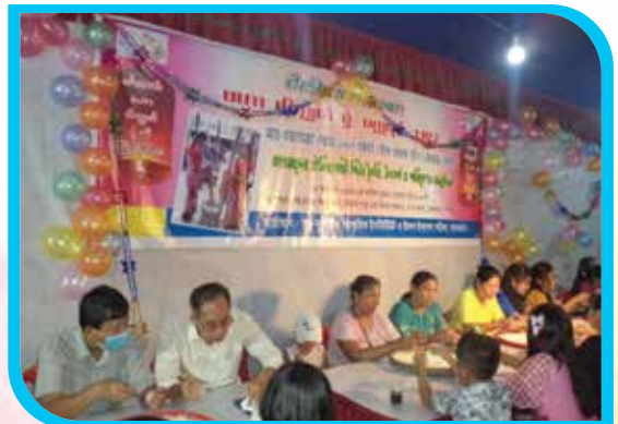
মাহা ওয়াগোয়াই পোয়েঃ ১৩৮৩ সাক্করই (পবিত্র প্রবারণা পূর্ণিমা) উপলক্ষে মারমাদের ঐতিহ্যবাহী পিঠা তৈরি অনুষ্ঠান