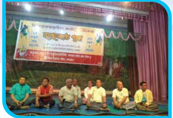
মারমাদের বর্ষবরণ উৎসব মাহা সাংগ্রাহিৎ পোয়েঃ উপলক্ষে বয়োজ্যেষ্ঠ পূজা অনুষ্ঠান