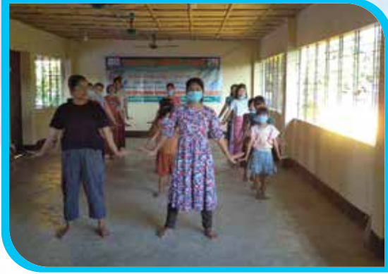
এক মাস মেয়াদি মারমা নৃত্য প্রশিক্ষণ কোর্স রোয়াংছড়ি পাড়া, রোয়াংছড়ি উপজেলা