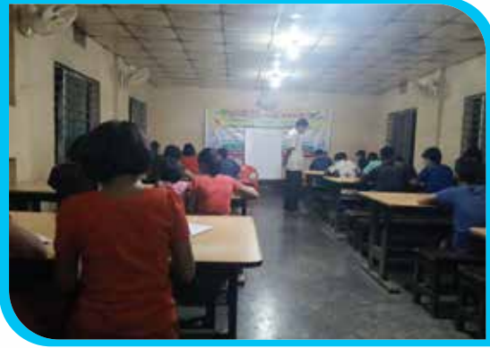
দুই মাস মেয়াদি ম্রো ভাষা শিক্ষা কোর্স (অক্ষর জ্ঞান) মহামুনি শিশু সদন, লামা পৌরসভা