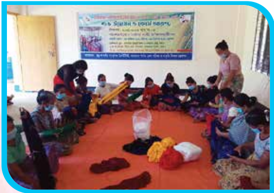
দুই মাস মেয়াদি মারমাদের ঐতিহ্যবাহী তাঁত বুনন ও পোশাক তৈরি প্রশিক্ষণ কোর্স, ইয়াংছা, লামা উপজেলা