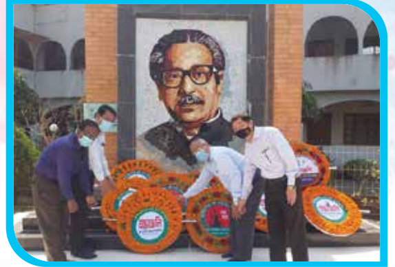
ঐতিহাসিক ৭ই মার্চ উপলক্ষে বান্দরবান পার্বত্য জেলা পরিষদ চত্বরে জাতির পিতা বঙ্গবন্ধু শেখ মুজিবুর রহমানের প্রতিকৃতিতে পুষ্পস্তবক অর্পণ