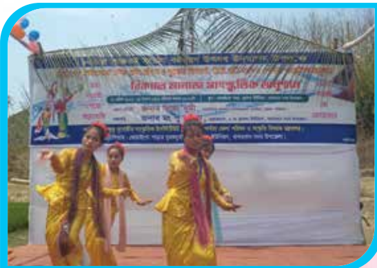
১৩৮৪ সাক্করই মারমা বর্ষবরণ উৎসব উদযাপন উপলক্ষে সাংস্কৃতিক অনুষ্ঠানে ইনস্টিটিউটের মারমা শিক্ষার্থীদের যইং নৃত্য পরিবেশন