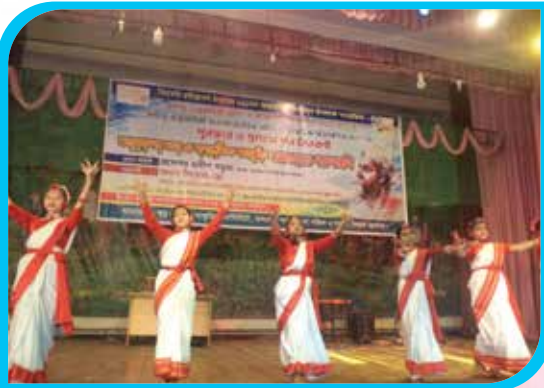
বিশ্বকবি রবীন্দ্রনাথ ঠাকুরের ১৬১তম জন্মবার্ষিকী উদ্‌যাপন অনুষ্ঠানে ইনস্টিটিউটের শিক্ষার্থীদের নৃত্য পরিবেশন