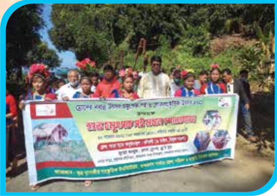
শুভ চমুংপক পই মঙ্গল শোভাযাত্রা