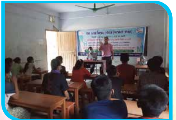
দুই মাস মেয়াদি বম ভাষা শিক্ষা কোর্স (অক্ষর জ্ঞান) লাইমি পাড়া, বান্দরবান সদর উপজেলা