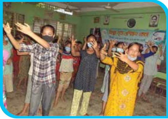
এক মাস মেয়াদি ত্রিপুরা নৃত্য প্রশিক্ষণ কোর্স কালাঘাটা, বান্দরবান পৌরসভা