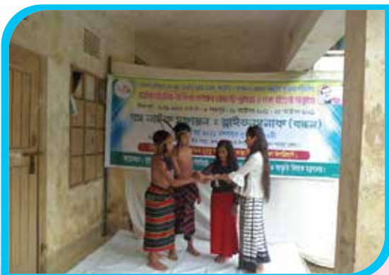
সাত কর্মদিবস মেয়াদি কর্মশালাভিত্তিক অভিনয় প্রশিক্ষণ কোর্স ও বম নাটক মঞ্চায়ন, লাইমি পাড়া, বান্দরবান সদর উপজেলা