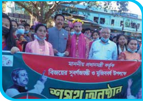
বিজয়ের সুবর্ণজয়ন্তী ও মুজিববর্ষ উপলক্ষে মাননীয় প্রধানমন্ত্রী কর্তৃক শপথ অনুষ্ঠানে অংশগ্রহণের জন্য আয়োজিত র্যালির শুভ সূচনা করেন পার্বত্য চট্টগ্রাম বিষয়ক মন্ত্রণালয়ের মাননীয় মন্ত্রী জনাব বীর বাহাদুর উশৈসিং, এমপি মহোদয়