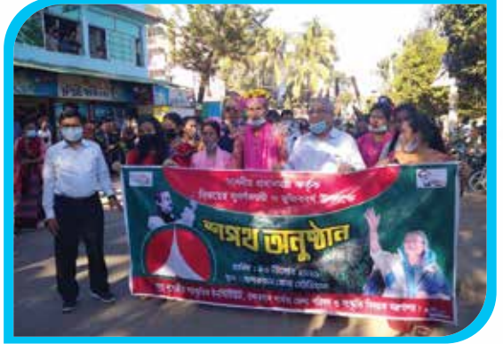
বিজয়ের সুবর্ণজয়ন্তী ও মুজিববর্ষ উপলক্ষে মাননীয় প্রধানমন্ত্রী কর্তৃক শপথ অনুষ্ঠানে অংশগ্রহণের জন্য আয়োজিত র্যালি