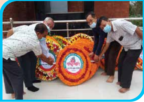
মহান স্বাধীনতা ও জাতীয় দিবস ২০২২ উপলক্ষে বান্দরবান পার্বত্য জেলা পরিষদ চত্বরে মুক্তিযুদ্ধ স্মৃতিস্তম্ভে পুষ্পস্তবক অর্পণ