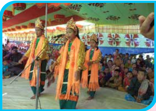
মারমাদের লোকসাংস্কৃতিক উৎসব ২০২১ উপলক্ষে পাংখুংসে লোকনৃত্য পরিবেশন