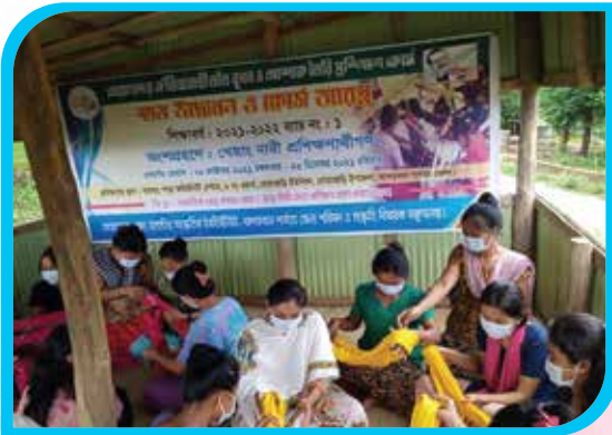
দুই মাস মেয়াদি খেয়াংদের ঐতিহ্যবাহী তাঁত বুনন ও পোশাক তৈরি প্রশিক্ষণ কোর্স, খামতাং পাড়া, রোয়াংছড়ি উপজেলা