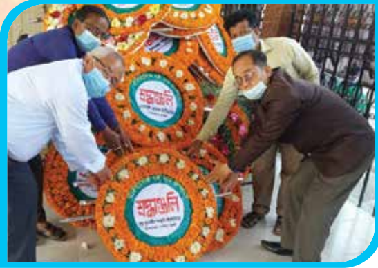
ঐতিহাসিক ৭ই মার্চ উপলক্ষে বঙ্গবন্ধু মুক্তমঞ্চে জাতির পিতা বঙ্গবন্ধু শেখ মুজিবুর রহমানের প্রতিকৃতিতে পুষ্পস্তবক অর্পণ