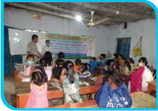
দুই মাস মেয়াদি চাকমা ভাষা শিক্ষা কোর্স (অক্ষর জ্ঞান) বালাঘাটা, বান্দরবান পৌরসভা