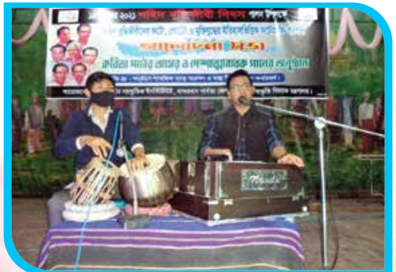
শহিদ বুদ্ধিজীবী দিবস ২০২১ উপলক্ষে ইনস্টিটিউটের শিক্ষার্থীর দেশাত্মবোধক গান পরিবেশন