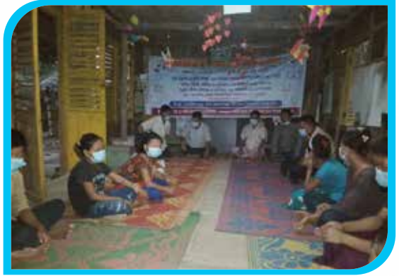
দুই মাস মেয়াদি তঞ্চঙ্গ্যা ভাষা শিক্ষা কোর্স (অক্ষর জ্ঞান) রেইছা সিনিয়র পাড়া, বান্দরবান সদর উপজেলা