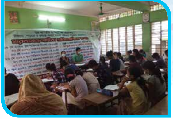
ত্রিপুরা ভাষায় সাহিত্য প্রতিযোগিতা কালঘাটা সরকারি প্রাথমিক বিদ্যালয়, বান্দরবান পৌরসভা