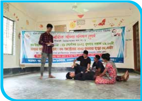
সাত কর্মদিবস মেয়াদি কর্মশালাভিত্তিক অভিনয় প্রশিক্ষণ কোর্স ও মারমা নাটক মঞ্চায়ন, খোয়াইংগ্যা পাড়া, বান্দরবান সদর উপজেলা