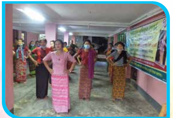
এক মাস মেয়াদি মারমা নৃত্য প্রশিক্ষণ কোর্স রুমা বাজার, রুমা উপজেলা