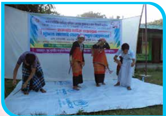
সাত কর্মদিবস মেয়াদি কর্মশালাভিত্তিক অভিনয় প্রশিক্ষণ কোর্স ও তঞ্চঙ্গ্যা নাটক মঞ্চায়ন, বটতলী পাড়া, রোয়াংছড়ি উপজেলা