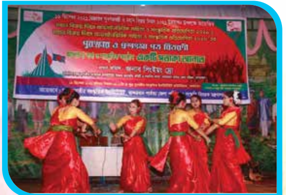
বিজয়ের সুবর্ণজয়ন্তী ও মহান বিজয় দিবস ২০২১ উপলক্ষে সাংস্কৃতিক অনুষ্ঠানে ইনস্টিটিউটের শিক্ষার্থীদের নৃত্য পরিবেশন