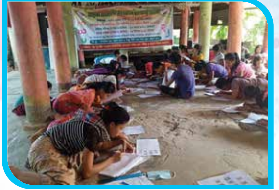
দুই মাস মেয়াদি মারমা ভাষা শিক্ষা কোর্স (অক্ষর জ্ঞান) ইয়াংছা বড় পাড়া, লামা উপজেলা