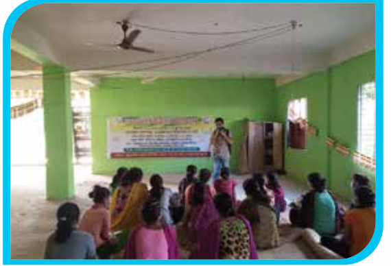
দুই মাস মেয়াদি তঞ্চঙ্গ্যা ভাষা শিক্ষা কোর্স (অক্ষর জ্ঞান) বাঘমারা, বান্দরবান সদর উপজেলা