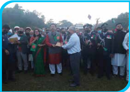
বিজয়ের সুবর্ণজয়ন্তী ও মুজিববর্ষ উপলক্ষে মাননীয় প্রধানমন্ত্রী কর্তৃক শপথ অনুষ্ঠানে অংশগ্রহণকারী শ্রেষ্ঠ র্যালি দলের জন্য পার্বত্য চট্টগ্রাম বিষয়ক মন্ত্রণালয়ের মাননীয় মন্ত্রী জনাব বীর বাহাদুর উশৈসিং, এমপি মহোদয় প্রদত্ত ১ম পুরস্কার গ্রহণ করছেন ইনস্টিটিউটের পরিচালক