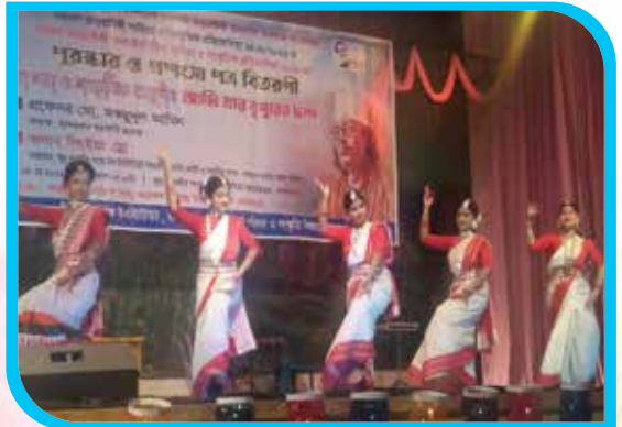
জাতীয় কবি কাজী নজরুল ইসলামের ১২৩তম জন্মবার্ষিকী উদ্‌যাপন অনুষ্ঠানে ইনস্টিটিউটের শিক্ষার্থীদের নৃত্য পরিবেশন