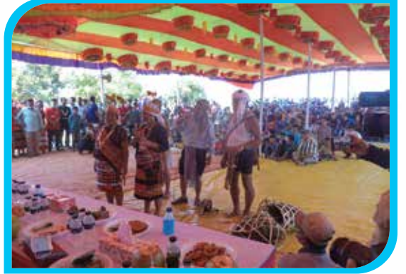
বমদের লোকসাংস্কৃতিক উৎসব ২০২১ উপলক্ষে বম লোকসংগীত পরিবেশন