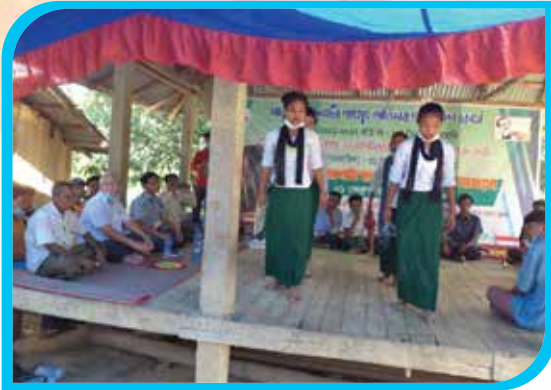
তিন মাস মেয়াদি মারমা লোকনাট্য পাংখুং অভিনয় প্রশিক্ষণ কোর্স তালুকদার পাড়া, রোয়াংছড়ি উপজেলা