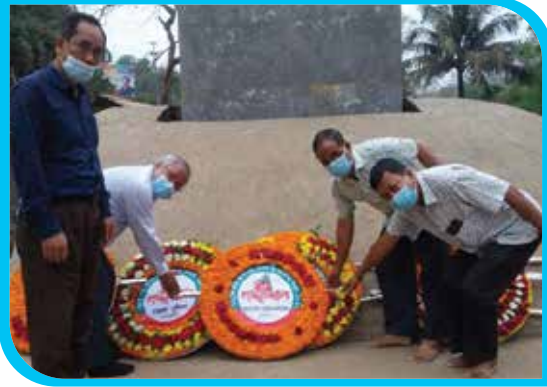
মহান স্বাধীনতা ও জাতীয় দিবস ২০২২ উপলক্ষে মুক্তিযুদ্ধ স্মৃতিফলকে পুষ্পস্তবক অর্পণ