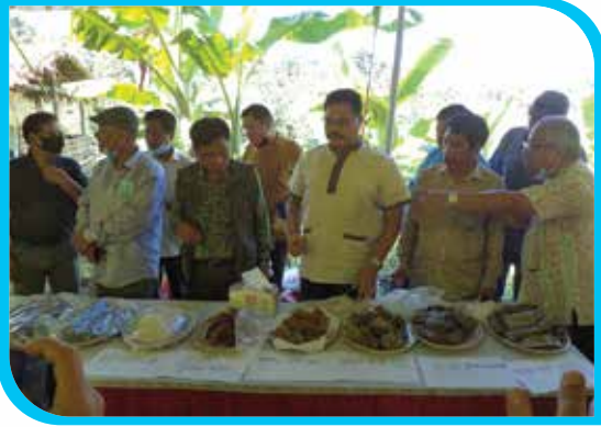
প্রধান অতিথি কর্তৃক নতুন ধানের পিঠামেলা পরিদর্শন