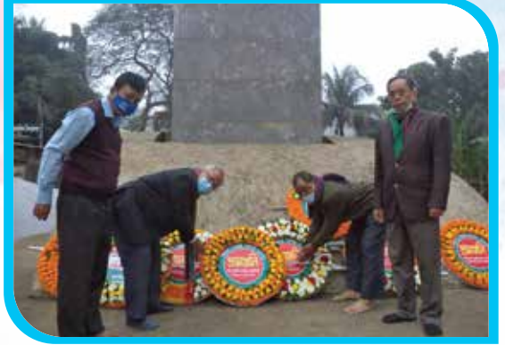
বিজয়ের সুবর্ণজয়ন্তী ও মহান বিজয় দিবস ২০২১ উপলক্ষে মুক্তিযুদ্ধ স্মৃতিফলকে পুষ্পস্তবক অর্পণ