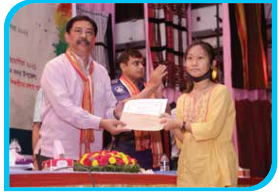
রচনা প্রতিযোগিতা ২০২১'এর পুরস্কার ও প্রশংসা পত্র বিতরণ করছেন পার্বত্য চট্টগ্রাম বিষয়ক মন্ত্রণালয়ের মাননীয় মন্ত্রী জনাব বীর বাহাদুর উশৈসিং, এমপি মহোদয়