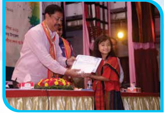
স্বাধীনতার সুবর্ণ জয়ন্তী জেলা পর্যায়ে অনলাইনভিত্তিক ক্ষুদ্র নৃ-গোষ্ঠীর সাংস্কৃতিক প্রতিযোগিতা ২০২১'এর পুরস্কার ও প্রশংসা পত্র বিতরণ করছেন পার্বত্য চট্টগ্রাম বিষয়ক মন্ত্রণালয়ের মাননীয় মন্ত্রী জনাব বীর বাহাদুর উশৈসিং, এমপি মহোদয়