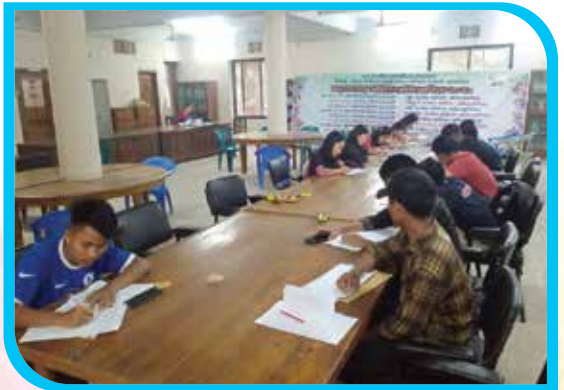
খুমী ভাষায় সাহিত্য প্রতিযোগিতা ক্ষুদ্র নৃ-গোষ্ঠীর সাংস্কৃতিক ইনস্টিটিউট, বান্দরবান