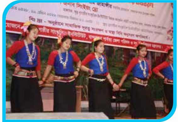
শুভ বাংলা নববর্ষ ১৪২৯ ও সাংগ্রাহিৎ-বিজু-বৈসু উৎসব উপলক্ষে সাংস্কৃতিক অনুষ্ঠানে ইনস্টিটিউটের শ্রো শিক্ষার্থীদের চাংক্রান নৃত্য পরিবেশন