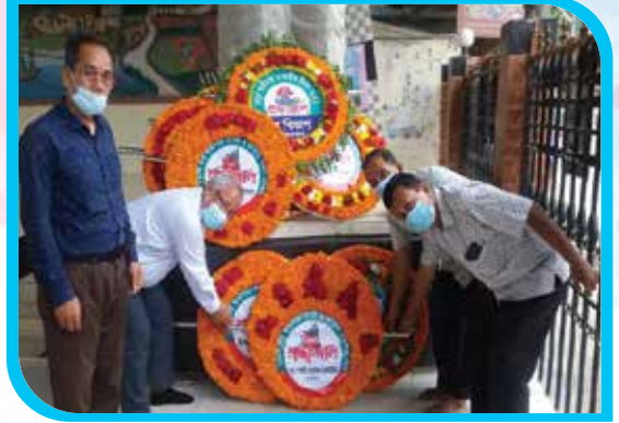
মহান স্বাধীনতা ও জাতীয় দিবস ২০২২ উপলক্ষে বঙ্গবন্ধু মুক্তমাঞ্চল জাতির পিতা বঙ্গবন্ধু শেখ মুজিবুর রহমানের প্রতিকৃতিতে পুষ্পস্তবক অর্পণ