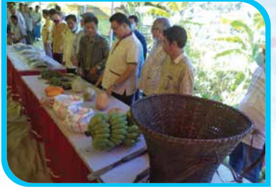
প্রধান অতিথি কর্তৃক জুমাচারের সরঞ্জামাদি ও জুমের নতুন ফসল পরিদর্শন