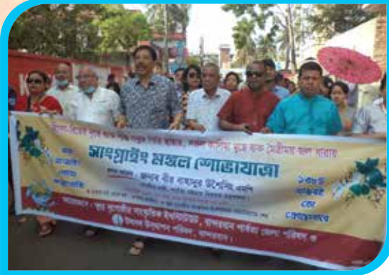
মারমাদের বর্ষবরণ উৎসব মাহা সাংগ্রাহিৎ পোয়েঃ উপলক্ষে সাংগ্রাহিৎ মঞ্জল শোভাযাত্রায় প্রধান অতিথি পার্বতা চট্টগ্রাম বিষয়ক মন্ত্রণালয়ের মাননীয় মন্ত্রী জনাব বীর বাহাদুর উশৈসিং, এমপি মহোদয়