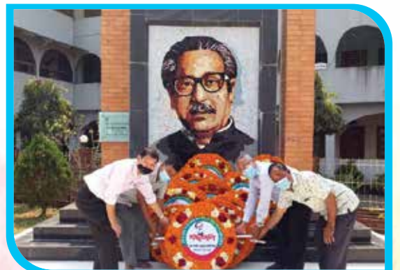
জাতির পিতা বঙ্গবন্ধু শেখ মুজিবুর রহমানের জন্মবার্ষিকী উপলক্ষে বান্দরবান পার্বত্য জেলা পরিষদ চত্বরে জাতির পিতা বঙ্গবন্ধু শেখ মুজিবুর রহমানের প্রতিকৃতিতে পুষ্পস্তবক অর্পণ