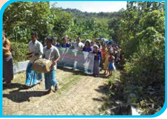
শুভ কক্সইচাঃ পোয়েঃ মঙ্গল শোভাযাত্রা