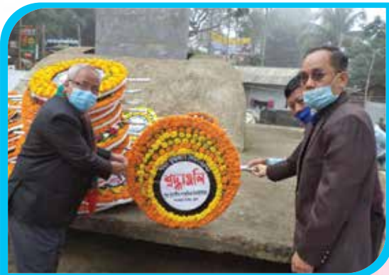
শহিদ বুদ্ধিজীবী দিবস ২০২১ উপলক্ষে মুক্তিযুদ্ধ স্মৃতিফলকে পুষ্পস্তবক অর্পণ