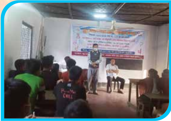
দুই মাস মেয়াদি শ্রো ভাষা শিক্ষা কোর্স (অক্ষর জ্ঞান) শ্রো কল্যাণ ছাত্রাবাস, আলীকদম উপজেলা