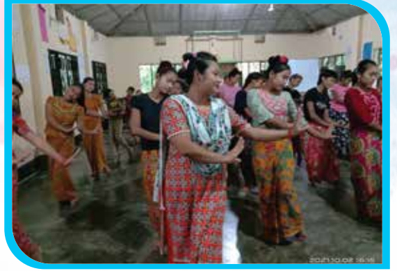
এক মাস মেয়াদি মারমা নৃত্য প্রশিক্ষণ কোর্স বান্দরবান বৌদ্ধ অনাথালয়