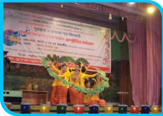
শুভ বাংলা নববর্ষ ১৪২৯ ও সাংগ্রাহিৎ-বিজু-বৈসু উৎসব উপলক্ষে সাংস্কৃতিক অনুষ্ঠানে ইনস্টিটিউটের মারমা শিক্ষার্থীদের পাখা নৃত্য পরিবেশন