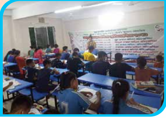
ম্রো ভাষায় সাহিত্য প্রতিযোগিতা, ম্রো আবাসিক উচ্চ বিদ্যালয় সুয়ালক, বান্দরবান সদর উপজেলা