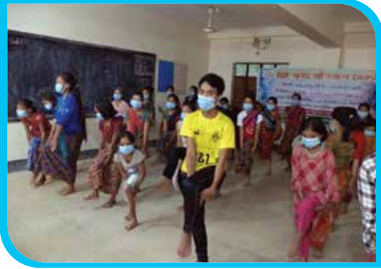
এক মাস মেয়াদি শ্রো নৃত্য প্রশিক্ষণ কোর্স সুয়ালক, বান্দরবান সদর উপজেলা