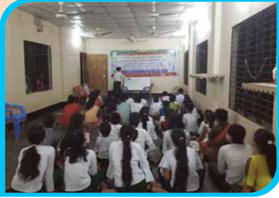
দুই মাস মেয়াদি মারমা ভাষা শিক্ষা কোর্স (অক্ষর জ্ঞান) শিলেরতুয়া মারমা পাড়া, লামা পৌরসভা