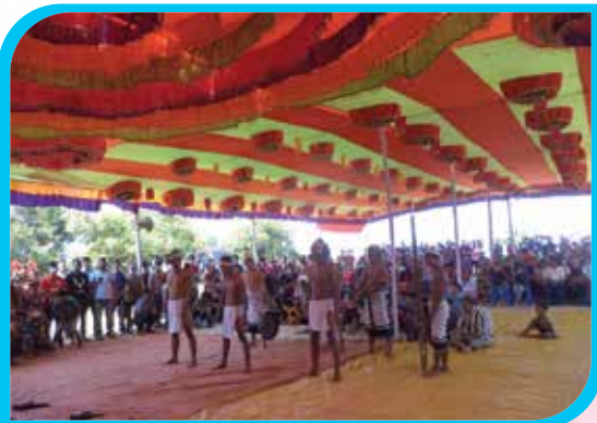
বমদের লোকসাংস্কৃতিক উৎসব ২০২১ উপলক্ষে বম লোকনৃত্য পরিবেশন