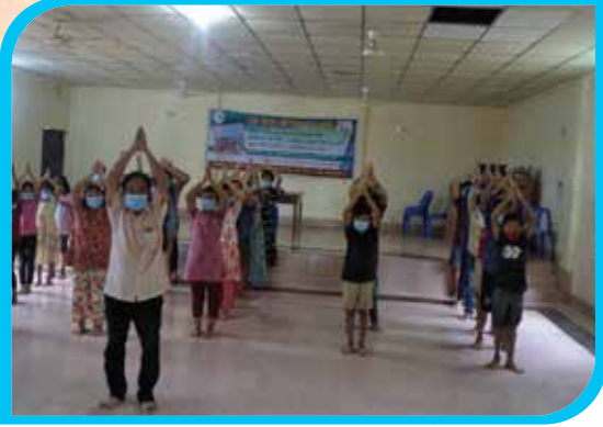
এক মাস মেয়াদি বম নৃত্য প্রশিক্ষণ কোর্স বেখেল পাড়া, রুমা উপজেলা