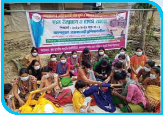
দুই মাস মেয়াদি তঞ্চঙ্গ্যাদের ঐতিহ্যবাহী তাঁত বুনন ও পোশাক তৈরি প্রশিক্ষণ কোর্স, বাঘমারা, বান্দরবান সদর উপজেলা