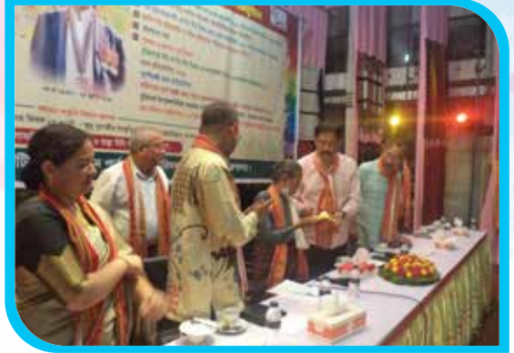
বীর মুক্তিযোদ্ধা ইউ কে চিং বীর বিক্রম-এর স্ত্রীকে সম্মানী প্রদান করছেন পার্বত্য চট্টগ্রাম বিষয়ক মন্ত্রণালয়ের মাননীয় মন্ত্রী জনাব বীর বাহাদুর উশৈসিং, এমপি মহোদয়