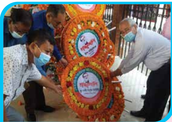
জাতির পিতা বঙ্গবন্ধু শেখ মুজিবুর রহমানের জন্মবার্ষিকী উপলক্ষে বঙ্গবন্ধু মুক্তমঞ্চে জাতির পিতা বঙ্গবন্ধু শেখ মুজিবুর রহমানের প্রতিকৃতিতে পুষ্পস্তবক অর্পণ