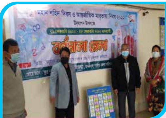
মহান শহিদ দিবস ও আন্তর্জাতিক মাতৃভাষা দিবস ২০২২ উপলক্ষে ফেব্রুয়ারি মাসব্যাপী বর্ণমালা মেলা আয়োজন