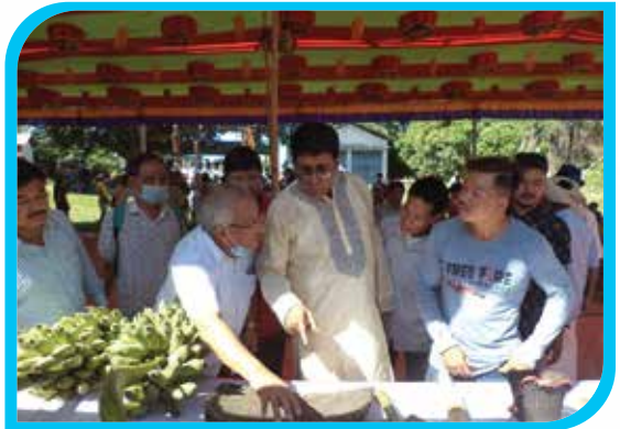
প্রধান অতিথি কর্তৃক জুমচাষের সরঞ্জামাদি পরিদর্শন