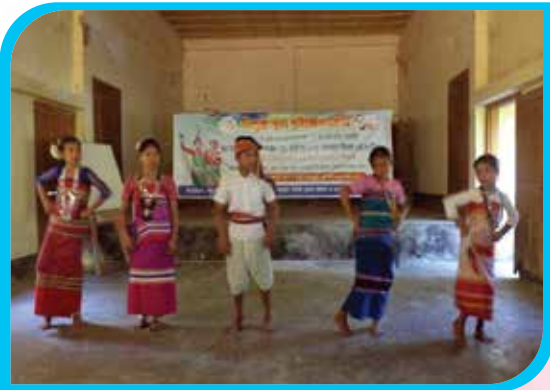
এক মাস মেয়াদি ত্রিপুরা নৃত্য প্রশিক্ষণ কোর্স অন্তহা ত্রিপুরা পাড়া, রোয়াংছড়ি উপজেলা