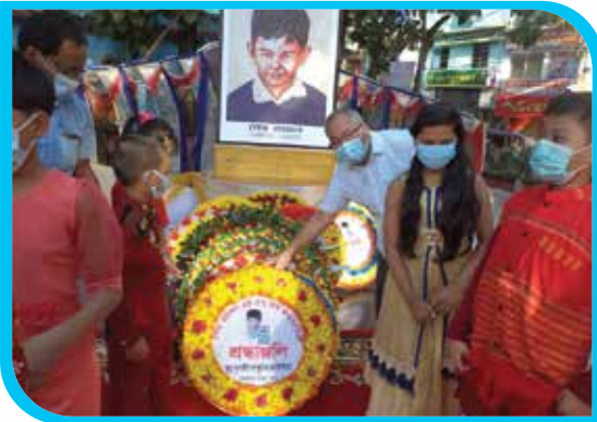
জাতির পিতা বঙ্গবন্ধু শেখ মুজিবুর রহমানের কনিষ্ঠ পুত্র শেখ রাসেলের জন্মদিন শেখ রাসেল দিবস ২০২২ উপলক্ষে শেখ রাসেলের প্রতিকৃতিতে পুষ্পস্তবক অর্পণ