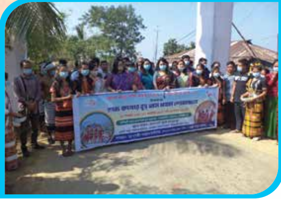
শুভ ফাথার বুহ্ তেম মঙ্গল শোভাযাত্রা