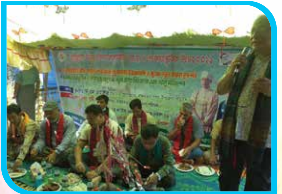
মারমাদের নবান্ন উৎসব কক্সইচাঃ পোয়েঃ ও লোকসাংস্কৃতিক উৎসব ২০২১ উপলক্ষে আলোচনা পর্বে ইনস্টিটিউট পরিচালকের স্বাগত বক্তব্য প্রদান