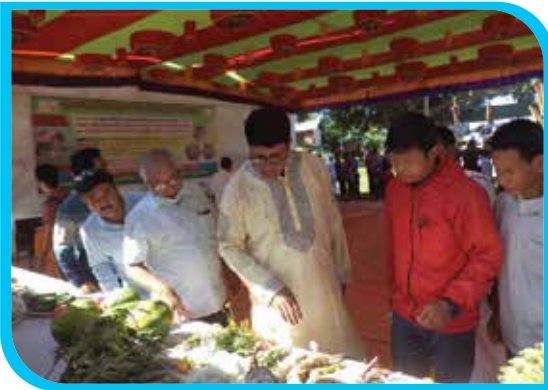
প্রধান অতিথি কর্তৃক জুমের নতুন ফসল পরিদর্শন