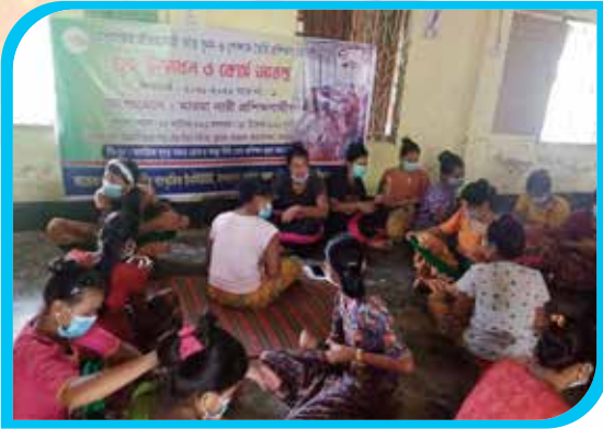
দুই মাস মেয়াদি মারমাদের ঐতিহ্যবাহী তাঁত বুনন ও পোশাক তৈরি প্রশিক্ষণ কোর্স, আমতলী মারমা পাড়া, বান্দরবান সদর উপজেলা