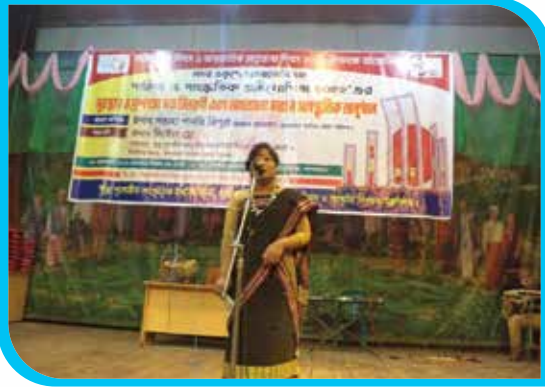
সাংস্কৃতিক অনুষ্ঠানে ইনস্টিটিউটের শিক্ষার্থীর একুশের কবিতা আবৃত্তি