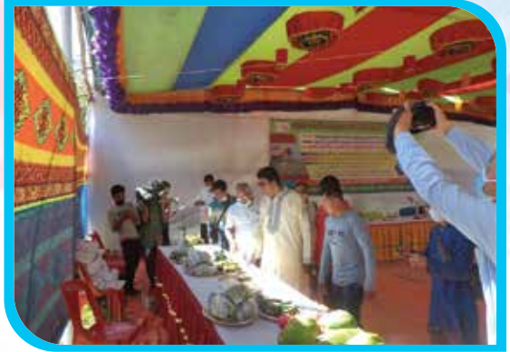
প্রধান অতিথি কর্তৃক নতুন ধানের পিঠামেলা পরিদর্শন