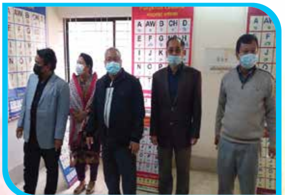
অতিথিগণের ফেব্রুয়ারি মাসব্যাপী আয়োজিত বর্ণমালা মেলা পরিদর্শন